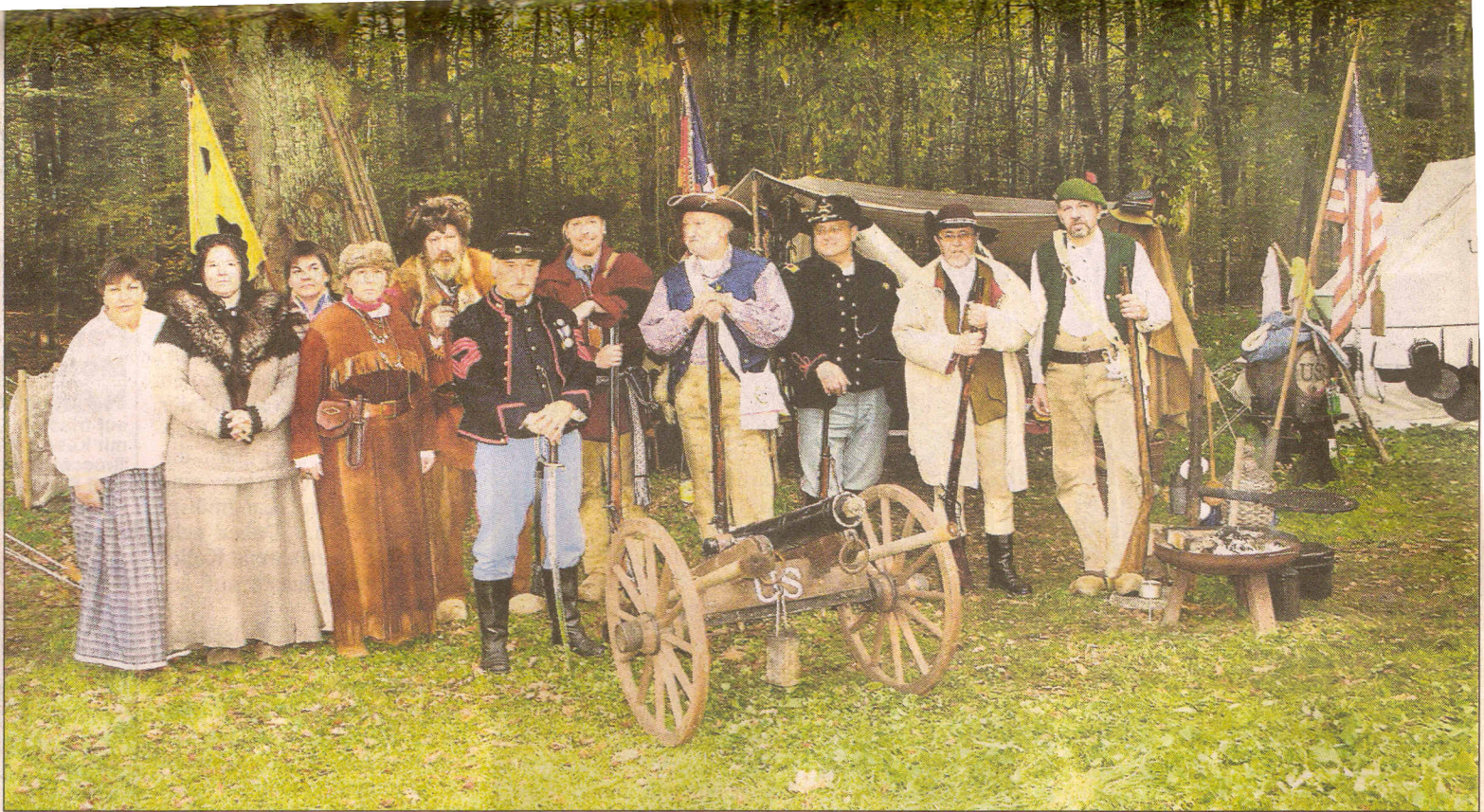
FAST wie beim Set in einem Hollywood-Western glich am Wochenende der Verdener Schützenplatz am Rande des Stadtwaldes. Die Schwarzpulverunion Aller-Weser hatte erneut zu einem Westerncamp eingeladen und mehr als 150 Fans „campierten“ auf dem Gelände.